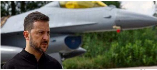
زینتسکی نے فضائیہ کے سربراہ کو برطرف کر دیا

Published from Birmingham (U.K.), India-Delhi, Mumbai, Lucknow, Dehradun Volume No.02, Issue No.55, Sunday 01 September, 2024, 8 Pages