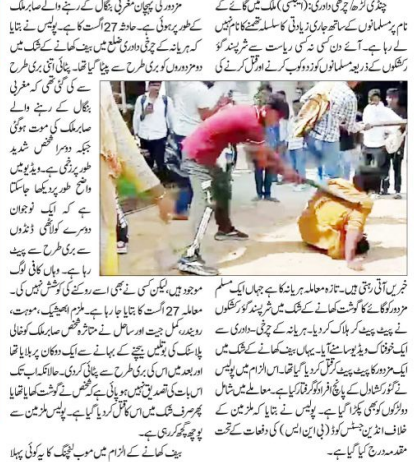
پٹائی لے جانے کا شبہ ٹرین میں ضعیف شخص کی بے رحمی سے پٹائی۔ مہاراشٹر کے ناسک میں واقعہ، ڈھلے سے ملز میں گورخواست میں لیا گیا۔

مہاراشٹر کے ناسک میں واقعہ، ڈھلے سے ملز میں گورخواست میں لیا گیا۔ بیف لے جانے کا شبہ ٹرین میں ضعیف شخص کی بے رحمی سے پٹائی۔ مہاراشٹر کے ناسک میں واقعہ، ڈھلے سے ملز میں گورخواست میں لیا گیا۔ مہاراشٹر کے ناسک میں واقعہ، ڈھلے سے ملز میں گورخواست میں لیا گیا۔ بیف لے جانے کا شبہ ٹرین میں ضعیف شخص کی بے رحمی سے پٹائی۔ مہاراشٹر کے ناسک میں واقعہ، ڈھلے سے ملز میں گورخواست میں لیا گیا۔