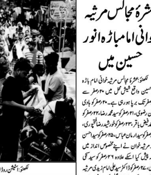
عشرہ مجالس مرثیہ خوانی امام باڑہ انور حسین میں