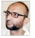
سکیل آزاد سخی تال انڈیا

آج کی ادبی صورت حال کو منظر عام پر لے آئے گلبرگہ کی ادبی صورت حال کی آئینہ دار نقشِ تحریر