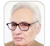
ایمر مہدی برطانیہ

آپ کی ادبی صورت حال کو منظر عام پر لے آئے گلبرگہ کی ادبی صورت حال کی آئینہ دار نقشِ تحریر