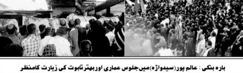
بارہ بنکی - علامہ پور (سیدواڑہ) میں جلوس عماری اور بہتر تابوت کی زیارت کا منظر۔