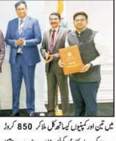
امریکہ میں اسٹالن نے 850 کروڑ روپے کی سرمایہ کاری کے مزید تین مفاہمت ناموں پر دستخط کیے

واشنگٹن (بی این آئی) امریکہ کے وزیر خارجہ مائیک پومپے نے کہا کہ امریکہ میں اسٹالن نے 850 کروڑ روپے کی سرمایہ کاری کے مزید تین مفاہمت ناموں پر دستخط کیے