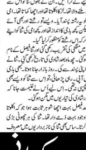
عمورت کہا مانی

عمورت کہا مانی کی شادی کے بارے میں لکھا گیا ہے۔ اس میں ان کی شادی کی تیاریوں اور شادی کے دن کی دلچسپی کو ظاہر کیا گیا ہے۔