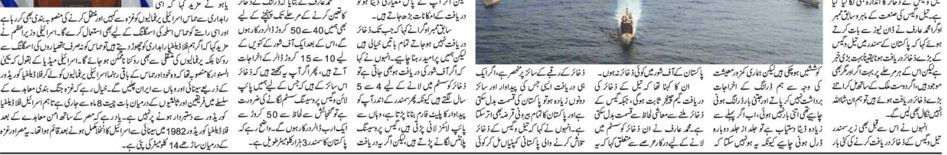
پاکستان کے سمندر میں دنیا کے چوتھے بڑے گیس اور تیل کے ذخائر کا انکشاف کیا گیا ہے۔

پاکستان کے سمندر میں دنیا کے چوتھے بڑے گیس اور تیل کے ذخائر کا انکشاف کیا گیا ہے۔ پاکستان کے سمندر میں دنیا کے چوتھے بڑے گیس اور تیل کے ذخائر کا انکشاف کیا گیا ہے۔