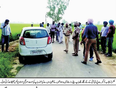
گجرات گجرات کے ایک علاقے میں لوگوں کی ایک بڑی تعداد نے ایک گاڑی کے گرد جمع ہو کر ایک تقریب منعقد کی

میشیل کافرٹس کانگریس میں کوئی ایمانداری نہیں ہے: محبوبہ مفتی