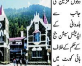
ہائی کورٹ نے ہلدوائی فسادات کے ملزمین کی ضمانت پر حکومت سے جواب طلب کیا

نئی دہلی (بی این آئی) ہائی کورٹ نے ہلدوائی فسادات کے ملزمین کی ضمانت پر حکومت سے جواب طلب کیا