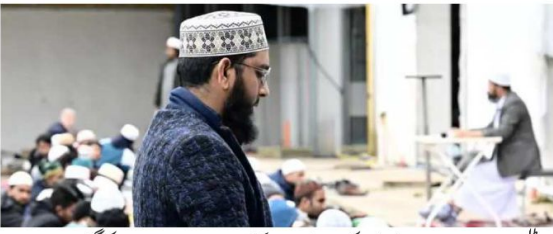
اٹلی کا وہ تہذیب جہاں مسلمانوں کی اجتماعی نماز اور کرکٹ سے پراپندی اور عاتک کی گئی ص: 08

Published from Birmingham (U.K.), India-Delhi, Mumbai, Lucknow, Dehradun