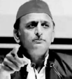
کھلیش نے کہا کہ بی جے پی حکومت میں سرکوں کے منصوبے بدعنوانی کا شکار ہو گئے۔

گھنٹہ: (بی اے آئی) بی جے پی حکومت میں سرکوں کے منصوبے بدعنوانی کا شکار ہو گئے۔ کھلیش نے کہا کہ بی جے پی حکومت میں سرکوں کے منصوبے بدعنوانی کا شکار ہو گئے۔