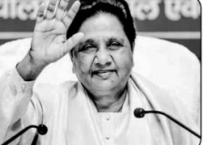
بی اے آئی کے صدر ایچ ایم ایچ نے کہا کہ عظیم ہستیوں کے معاملے میں سیاست درست نہیں ہے۔

گھنٹہ: (بی اے آئی) مہاراشٹر کے ایک جانا چاہنے والے نے کہا کہ کسی بھی عظیم ہستیوں کے معاملے میں سیاست درست نہیں ہے۔ بی اے آئی نے کہا کہ عظیم ہستیوں کے معاملے میں سیاست درست نہیں ہے۔ بی اے آئی نے کہا کہ عظیم ہستیوں کے معاملے میں سیاست درست نہیں ہے۔