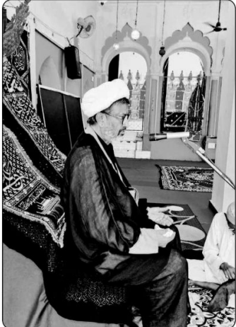
گھنٹہ: (صحافت بیورو) عالم پور (سیدواڑہ) میں جلوس عماری اور بہتر تابوت برآمد۔

گھنٹہ: (صحافت بیورو) عالم پور (سیدواڑہ) میں جلوس عماری اور بہتر تابوت برآمد۔ جلوس میں لوگوں کا بڑا ہجوم دیکھا گیا۔