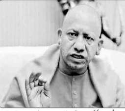
یوگی نے کہا کہ حکومت کو پیسے ادا کرنے کے بغیر علاج کرائیں، حکومت پیسے ادا کرے گی۔

گورکھ پور (بی اے آئی) وزیر اعلیٰ یوگی نے کہا کہ حکومت کو پیسے ادا کرنے کے بغیر علاج کرائیں، حکومت پیسے ادا کرے گی۔ یوگی نے کہا کہ حکومت کو پیسے ادا کرنے کے بغیر علاج کرائیں، حکومت پیسے ادا کرے گی۔