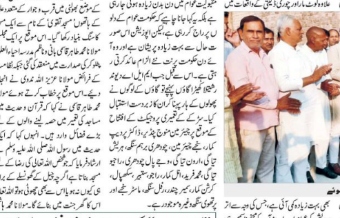
تعمیراتی کاموں میں متعدد علماء کے ہاتھوں مسجد تقویٰ کے نام سے مسجد کا سنگ۔

دو ہفتہ (دھرتی) راجھویشیہ میں اس وقت پورے اتر پردیش میں ترقیاتی کاموں کو ترجیحی طور پر کرائے جا رہے ہیں۔ اس موقع پر وزیر اعلیٰ نے شیشیا کھیر گاؤں میں ایل اے فنانڈ سے تعمیراتی کام شروع کیا۔