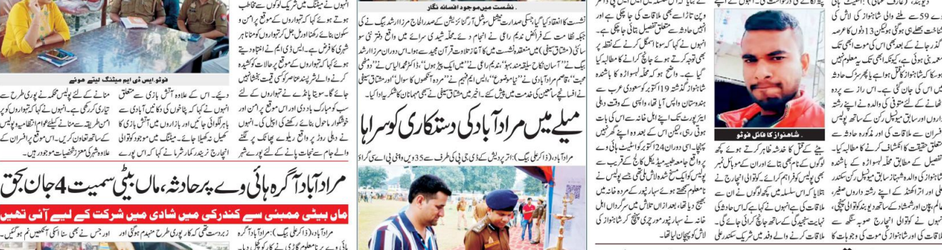
موتی کی والدہ نے افسران سے ملاقات کی اور مذکورہ حادثے میں متعلق حقیقت کا انکشاف کرنے کا مطالبہ کیا۔

موتی کی والدہ نے افسران سے ملاقات کی اور مذکورہ حادثے میں متعلق حقیقت کا انکشاف کرنے کا مطالبہ کیا