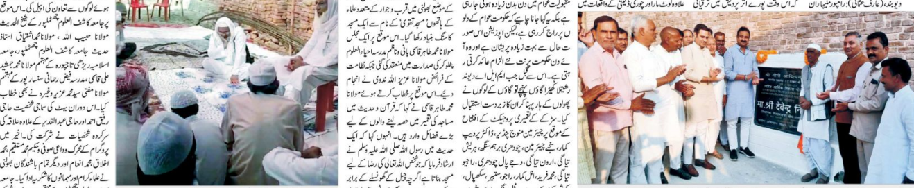
دو ہفتہ (دھرتی) راجھویشیہ میں اس وقت پورے اتر پردیش میں ترقیاتی کاموں کو ترجیحی طور پر کرائے جا رہے ہیں۔ اس موقع پر وزیر اعلیٰ نے شیشیا کھیر گاؤں میں ایل اے فنانڈ سے تعمیراتی کام شروع کیا۔

راہو و مینیاں کے ایل اے نے شیشیا کھیر گاؤں میں ایل اے فنانڈ سے تعمیراتی کام شروع کیا