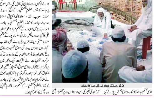
تعمیراتی کاموں میں متعدد علماء کے ہاتھوں مسجد تقویٰ کے نام سے مسجد کا سنگ۔

دو ہفتہ (دھرتی) راجھویشیہ میں اس وقت پورے اتر پردیش میں ترقیاتی کاموں کو ترجیحی طور پر کرائے جا رہے ہیں۔ اس موقع پر وزیر اعلیٰ نے شیشیا کھیر گاؤں میں ایل اے فنانڈ سے تعمیراتی کام شروع کیا۔