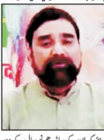
پونہ میں دو نئے کارخانوں کی بنیاد رکھنے کے لیے دو نئے کارخانوں کی بنیاد رکھی ہے۔

پونہ میں دو نئے کارخانوں کی بنیاد رکھنے کے لیے دو نئے کارخانوں کی بنیاد رکھی ہے۔ پونہ میں دو نئے کارخانوں کی بنیاد رکھنے کے لیے دو نئے کارخانوں کی بنیاد رکھی ہے۔ پونہ میں دو نئے کارخانوں کی بنیاد رکھنے کے لیے دو نئے کارخانوں کی بنیاد رکھی ہے۔ پونہ میں دو نئے کارخانوں کی بنیاد رکھنے کے لیے دو نئے کارخانوں کی بنیاد رکھی ہے۔ پونہ میں دو نئے کارخانوں کی بنیاد رکھنے کے لیے دو نئے کارخانوں کی بنیاد رکھی ہے۔