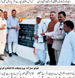
تعمیراتی کاموں میں متعدد علماء کے ہاتھوں مسجد تقویٰ کے نام سے مسجد کا سنگ۔

دو ہفتہ (دھرتی) راجھویشیہ میں اس وقت پورے اتر پردیش میں ترقیاتی کاموں کو ترجیحی طور پر کرائے جا رہے ہیں۔ اس موقع پر وزیر اعلیٰ نے شیشیا کھیر گاؤں میں ایل اے فنانڈ سے تعمیراتی کام شروع کیا۔