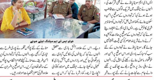
تہواروں کے موقع پر حالات کو گمان ڈالنے والے پندرہ سرگرموں کو پکڑا گیا۔

دو ہفتہ (دھرتی) راجھویشیہ میں اس وقت پورے اتر پردیش میں ترقیاتی کاموں کو ترجیحی طور پر کرائے جا رہے ہیں۔ اس موقع پر وزیر اعلیٰ نے شیشیا کھیر گاؤں میں ایل اے فنانڈ سے تعمیراتی کام شروع کیا۔