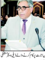
پونہ میں دو نئے کارخانوں کی بنیاد رکھنے کے لیے دو نئے کارخانوں کی بنیاد رکھی ہے۔

مدھی کا حیدرآباد میں انتخابی جلسہ آج مدھی کا حیدرآباد میں انتخابی جلسہ آج مدھی کا حیدرآباد میں انتخابی جلسہ آج مدھی کا حیدرآباد میں انتخابی جلسہ آج مدھی کا حیدرآباد میں انتخابی جلسہ آج