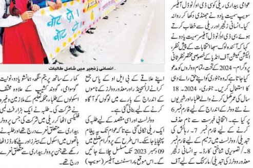
1000 فٹ لمبی فلیکسیس ٹوجہ کا مرکز رہی۔

لاٹری یا آن لائن درخواست قائم کرنے اور ڈاکٹر انکارڈو نے اور بی ایس اے ایجنٹ