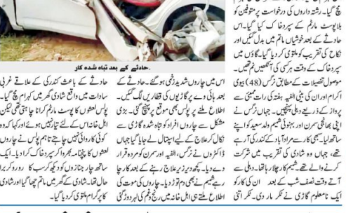
مراد آباد آگرہ ہائی وے پر حادثہ، ماں بیٹی سمیت 4 جان بحق۔

ماں بیٹی سمیت چار افراد کی موت ہوئی۔ حادثے کی وجہ سے گاڑی ٹکرائی اور آگ لگی۔