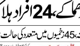
غزہ کی پٹی میں اسرائیل کے میزائل حملوں کے نتیجے میں زخمی فلسطینیوں کی تصویریں۔