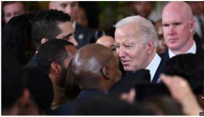
سیاہ فام مذہبی رہنماؤں کا بائیکاٹ کرنے سے غرہ جنگ بند کرنے کا مطالبہ

Published from Birmingham (U.K.), India-Delhi, Mumbai, Lucknow, Dehradun