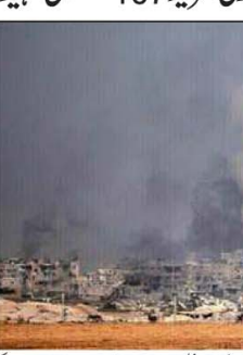
اسرائیلی فوجوں کی غزہ کی پٹی میں اسرائیل کے میزائل حملوں کی تصویریں۔

اس معاہدے کے تحت فلسطینیوں کو 1500 سالہ قیدیوں کی رہائی کی پیشکش کی جائے گی۔ اس معاہدے کے تحت فلسطینیوں کو 1500 سالہ قیدیوں کی رہائی کی پیشکش کی جائے گی۔ اس معاہدے کے تحت فلسطینیوں کو 1500 سالہ قیدیوں کی رہائی کی پیشکش کی جائے گی۔