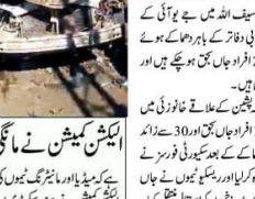
غزہ کی پٹی میں اسرائیل کے میزائل حملوں کے نتیجے میں زخمی فلسطینیوں کی تصویریں۔