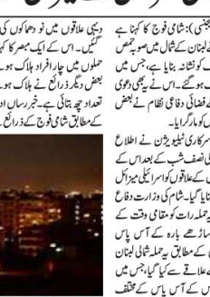
غزہ کی پٹی میں اسرائیل کے میزائل حملوں کے نتیجے میں زخمی فلسطینیوں کی تصویریں۔