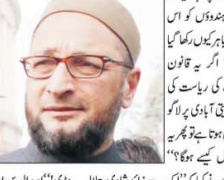
ایس ایچ آر کے خلاف ایک نیا قانون پیش کیا گیا ہے۔ اس بل کے تحت ہندو کوڈ کے علاوہ کچھ نہیں، یہ آئین کی کھلی خلاف ورزی ہے۔

نئی دہلی، (پان آئی) اتراکھنڈ کی بی جے پی حکومت نے ایس ایچ آر کے خلاف ایک نیا قانون پیش کیا ہے۔ اس بل کے تحت ہندو کوڈ کے علاوہ کچھ نہیں، یہ آئین کی کھلی خلاف ورزی ہے۔ اویسی نے اس بل کو شدید طور پر مذمت کیا ہے۔