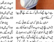
غزہ کی پٹی میں اسرائیل کے میزائل حملوں کے نتیجے میں ہلاک ہوئے فلسطینیوں کی تصویریں۔