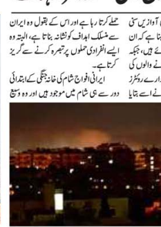
غزہ کی پٹی میں اسرائیل کے میزائل حملوں کے نتیجے میں ہلاک ہوئے فلسطینیوں کی تصویریں۔