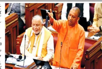
نئی دہلی (پریس ریلیز) ایڈیشن: وزیر اعلیٰ یوگی نے آج پتھارے کے ساتھ نا انصافی کی گئی ہے۔

اساتذہ تفرری گھپلا میں سابق وزیر تعلیم پارٹو چڑھتی کے کردار کی جانچ پھر شروع کی گئی ہے۔ سابق وزیر تعلیم پارٹو چڑھتی کے کردار کی جانچ پھر شروع کی گئی ہے۔ سابق وزیر تعلیم پارٹو چڑھتی کے کردار کی جانچ پھر شروع کی گئی ہے۔