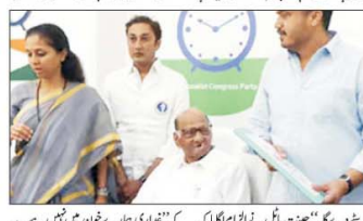
ایکشن میکشن کے فیصلے پر ایم وی اے کے لیڈران سخت برہم، بی پی کے پناہ گزینوں کو دوبارہ فیصلہ کرادیا۔

ممبئی، (پان آئی) بی پی کے پناہ گزینوں کو دوبارہ فیصلہ کرادیا۔ ایکشن میکشن کے فیصلے پر ایم وی اے کے لیڈران سخت برہم، بی پی کے پناہ گزینوں کو دوبارہ فیصلہ کرادیا۔ ایکشن میکشن کے فیصلے پر ایم وی اے کے لیڈران سخت برہم، بی پی کے پناہ گزینوں کو دوبارہ فیصلہ کرادیا۔