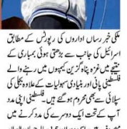
غزہ کی پٹی میں اسرائیل کے میزائل حملوں کے نتیجے میں زخمی فلسطینیوں کی تصویریں۔