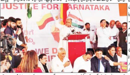
آرنہا کے وزیر اعلیٰ ساراما اور نائب وزیر اعلیٰ کے ٹیکس منتقلی کے خلاف احتجاج کی قیادت کی جس میں مرکزی حکومت کے خلاف مظاہرہ کیا گیا۔

دہلی، (پان آئی) آرنہا کے وزیر اعلیٰ ساراما اور نائب وزیر اعلیٰ کے ٹیکس منتقلی کے خلاف احتجاج کی قیادت کی جس میں مرکزی حکومت کی ٹیکس پالیسیوں کے خلاف مظاہرہ کیا گیا۔ مسٹر ساراما نے کہا کہ حکومت نے ٹیکس منتقلی کے خلاف احتجاج کی قیادت کی جس میں مرکزی حکومت کے خلاف مظاہرہ کیا گیا۔ مسٹر ساراما نے کہا کہ حکومت نے ٹیکس منتقلی کے خلاف احتجاج کی قیادت کی جس میں مرکزی حکومت کے خلاف مظاہرہ کیا گیا۔