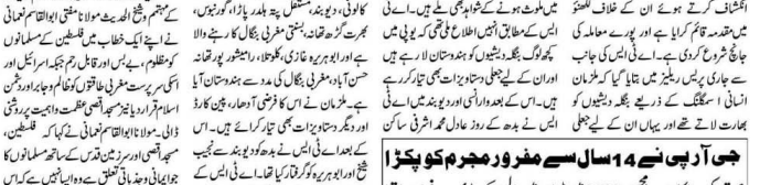
عریضہ کی سزا کاٹ کر 14 سال سے مفرور مجرم کو پکڑا