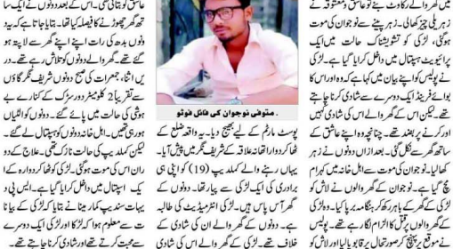
مخوش نوجوان کی مہل خانو