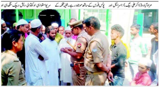
جموں پولیس سے بات کرتے پولیس