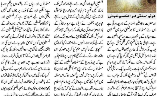
ذیہ یون، جب کہ دوری حضرت مسلمان