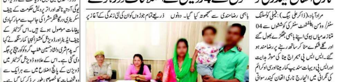
ایس ایس ایس نے لکھنؤ میں مقدمہ قائم کرایا ہے اور دیوبند معاملہ کی جان شروع کر دی ہے