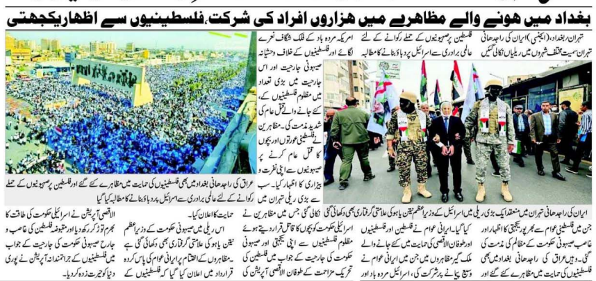
بغداد میں ہونے والے مظاہرے میں ہزاروں افراد کی شرکت، فلسطینیوں سے اظہار یکجہتی۔ ایران کی فضا میں فلسطینیوں کی حمایت اور غاصب صیہونی حکومت کے خلاف نعروں سے گونجی اٹھی۔