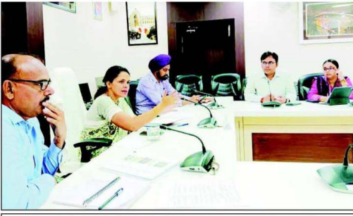
گھنٹہ گزاری میں کئی اخباری نمائندوں نے شرکت کی اور ان کے ساتھ ساتھ...