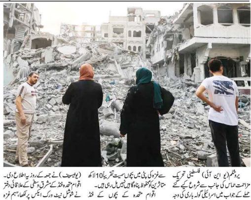
غزہ کی حالت دیکھ کر دل ہلکا ہوتا ہے۔ غزہ میں کوئی محفوظ پناہ گاہ نہیں ہے۔ اسرائیلی حملوں میں ہلاکتوں کا شمار دنیا کی کسی اور جگہ سے زیادہ ہے۔

آئے والے مناظر سے غزہ کی حالت دیکھ کر دل ہلکا ہوتا ہے۔ غزہ میں کوئی محفوظ پناہ گاہ نہیں ہے۔ اسرائیلی حملوں میں ہلاکتوں کا شمار دنیا کی کسی اور جگہ سے زیادہ ہے۔ 10 لاکھ لوگوں کے پاس رہنے کے لیے کوئی محفوظ جگہ نہیں ہے۔ 1659 حملے ہوئے ہیں۔ 276 ہلاکتیں ہوئی ہیں۔ 2127 افراد زخمی ہوئے ہیں۔ 500 سے زائد افراد زخمی ہوئے ہیں۔ 276 ہلاکتیں ہوئی ہیں۔ 2127 افراد زخمی ہوئے ہیں۔ 500 سے زائد افراد زخمی ہوئے ہیں۔