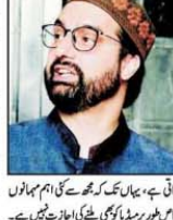
نظر بندی سے مستقل رہائی کیلئے عدالت میں عرض وادارگی جائے گی: میر واعظ۔

نظر بندی سے مستقل رہائی کیلئے عدالت میں عرض وادارگی جائے گی: میر واعظ۔ نظر بندی سے مستقل رہائی کیلئے عدالت میں عرض وادارگی جائے گی: میر واعظ۔