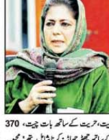
بی جے پی کو شیخ خاندان کا شکر گزار رہنا چاہیے: محبوبہ مفتی۔

بی جے پی کو شیخ خاندان کا شکر گزار رہنا چاہیے: محبوبہ مفتی۔ بی جے پی کو شیخ خاندان کا شکر گزار رہنا چاہیے: محبوبہ مفتی۔