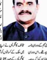
معانی یا تراکیبی لسانی چاہیے: وشووت۔

معانی یا تراکیبی لسانی چاہیے: وشووت۔ معانی یا تراکیبی لسانی چاہیے: وشووت۔