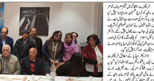
فرانز باک سے ۱۰۰۰ روپے کے جرمنی کی شہادت کے کٹھن کو مبارکباد اور ان کی شہادت کے اعتراف کے لیے... ان کے ساتھ سٹیڈیو کے فرائض بھی سر انجام دیے۔

نعت سرور کائنات صل اللہ علیہ وآلہ وسلم تقدیرنقی میدہ دور ہے گس میدہ چشم تر میں ہے قصور میں ہے روضہ گنبد خضرنا نظر میں ہے مجھے رستہ دکھائی جارہی ہے میری بے چینی نشان راہ طیبہ تو مرے زاد رست میں ہے مرے دامن میں وسعت ہی گاہی اکنایں شہادت کی