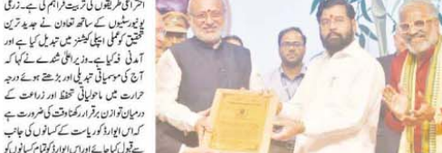
ان اہلکاروں کے ساتھ ساتھ انگریز اہلکاروں کے بھی... ان کے ساتھ سٹیڈیو کے فرائض بھی سر انجام دیے۔

گورنر کے گھرواؤں سے ملنے والے جوانوں کو مختلف مقامات پر ماریا دیا گیا۔ شہادت کے اعتراف کے لیے... ان کے ساتھ سٹیڈیو کے فرائض بھی سر انجام دیے۔