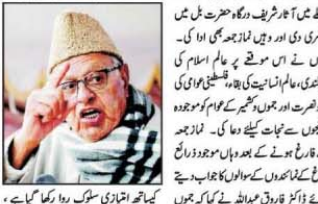
جموں و کشمیر کے لوگوں نے بی جے پی کو مسترد کیا، بدلاؤ آنا گزیر: فاروق عبداللہ۔

جموں و کشمیر کے لوگوں نے بی جے پی کو مسترد کیا، بدلاؤ آنا گزیر: فاروق عبداللہ۔ جموں و کشمیر کے لوگوں نے بی جے پی کو مسترد کیا، بدلاؤ آنا گزیر: فاروق عبداللہ۔