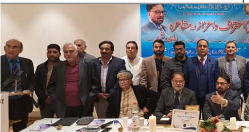
معارضہ شرف اکیڈمی جرمنی نے اپنا کام چلایا اور ان کی ہیرہ تریوں میں شہادت کا ذکر کرتے ہوئے... ان کے ساتھ سٹیڈیو کے فرائض بھی سر انجام دیے۔