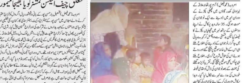
امروہ (تحریک) کے دن اور پھل HEW کے وقت، جہاڑی کا دن میں سے بیٹیوں کو ایک دن کیلئے بنایا گیا۔ افسر لوگوں سے ہڑپے 49 لاکھ روپے کے لئے بنایا گیا۔