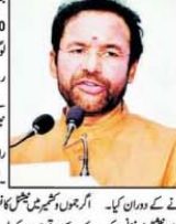
میشیل کانفرنس نے جموں و کشمیر میں دہشت گردی کو بڑھا دیا: جی کشن ریڈی۔

میشیل کانفرنس نے جموں و کشمیر میں دہشت گردی کو بڑھا دیا: جی کشن ریڈی۔ میشل کانفرنس نے جموں و کشمیر میں دہشت گردی کو بڑھا دیا: جی کشن ریڈی۔