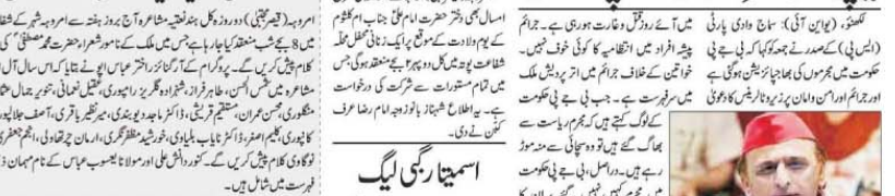
امروہ (تحریک) کے دن اور پھل HEW کے وقت، جہاڑی کا دن میں سے بیٹیوں کو ایک دن کیلئے بنایا گیا۔ افسر لوگوں سے ہڑپے 49 لاکھ روپے کے لئے بنایا گیا۔