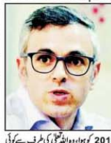
بی جے پی کے پراسی امیدواروں سے ہوشیار رہنے کی ضرورت: عمر عبداللہ۔

بی جے پی کے پراسی امیدواروں سے ہوشیار رہنے کی ضرورت: عمر عبداللہ۔ بی جے پی کے پراسی امیدواروں سے ہوشیار رہنے کی ضرورت: عمر عبداللہ۔ بی جے پی کے پراسی امیدواروں سے ہوشیار رہنے کی ضرورت: عمر عبداللہ۔