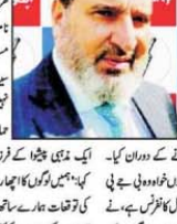
جموں و کشمیر میں روایتی جماعتوں نے لوگوں کے احساسات کو لوٹا ہے: سید الطاف بخاری۔

جموں و کشمیر میں روایتی جماعتوں نے لوگوں کے احساسات کو لوٹا ہے: سید الطاف بخاری۔ جموں و کشمیر میں روایتی جماعتوں نے لوگوں کے احساسات کو لوٹا ہے: سید الطاف بخاری۔