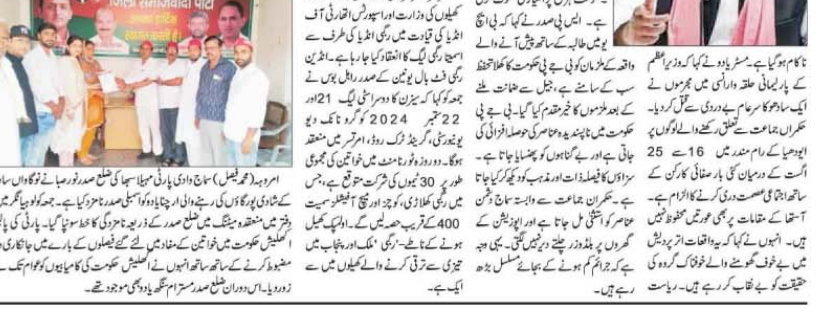
امروہ (تحریک) کے دن اور پھل HEW کے وقت، جہاڑی کا دن میں سے بیٹیوں کو ایک دن کیلئے بنایا گیا۔ افسر لوگوں سے ہڑپے 49 لاکھ روپے کے لئے بنایا گیا۔