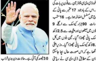
جنوبی بنگال کے ایک نوجوان نے وزیر اعظم نریندر مودی کو خط لکھ کر ان کی حکومت کے خلاف سنگین الزامات لگائے ہیں۔

جنوبی بنگال کے ایک نوجوان نے وزیر اعظم نریندر مودی کو خط لکھ کر ان کی حکومت کے خلاف سنگین الزامات لگائے ہیں۔ خط میں مودی کی حکومت کے خلاف سنگین الزامات لگائے گئے ہیں۔ خط میں مودی کی حکومت کے خلاف سنگین الزامات لگائے گئے ہیں۔