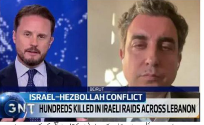
ISRAEL-HEZBOLLAH CONFLICT HUNDREDS KILLED IN ISRAELI RAIDS ACROSS LEBANON

لبنان کے رکن پارلیمنٹ نے کہا کہ حقیقت ہے کہ اسرائیل لبنان کے تمام عوام کو اپنی مزاحمت سے دوچار ہے۔ اس کی ساری کی ساری مہماری وہ کر رہا ہے۔ اسرائیلی فوج نے لبنان کے لیے اپنی فوجیں بھیج دی ہیں۔