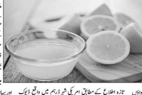
لیمن پانی کی وجہ سے گردے میں پتھریوں کی تشکیل کو روکا جاتا ہے۔

ہرین کے مطابق گردے کے پتھریوں سے بچاؤ کیلئے لیمن پانی اور پانی کی ضرورت ہے۔ لیمن پانی کی وجہ سے گردے میں پتھریوں کی تشکیل کو روکا جاتا ہے۔ لیمن پانی کی وجہ سے گردے میں پتھریوں کی تشکیل کو روکا جاتا ہے۔ لیمن پانی کی وجہ سے گردے میں پتھریوں کی تشکیل کو روکا جاتا ہے۔