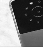
اسمارٹ فون میں 9 میگا پیکسل کی فوٹو کیسے لیں؟