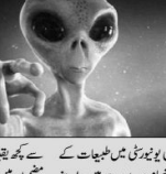
خالئی مطلق وجود رکھتے ہیں: ناسا کے سائنسدان کا انکشاف۔